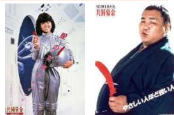
1980年代ポスター(一部)

共同募金運動は、昭和22年に市民主体の民間運動として始まりました。創設当時は、戦災復興のために役立てられました。現在では社会福祉法で定められた「地域福祉の推進」を目的に運動が展開されています。