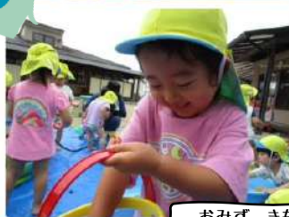
おみず、きもちいいなあ!